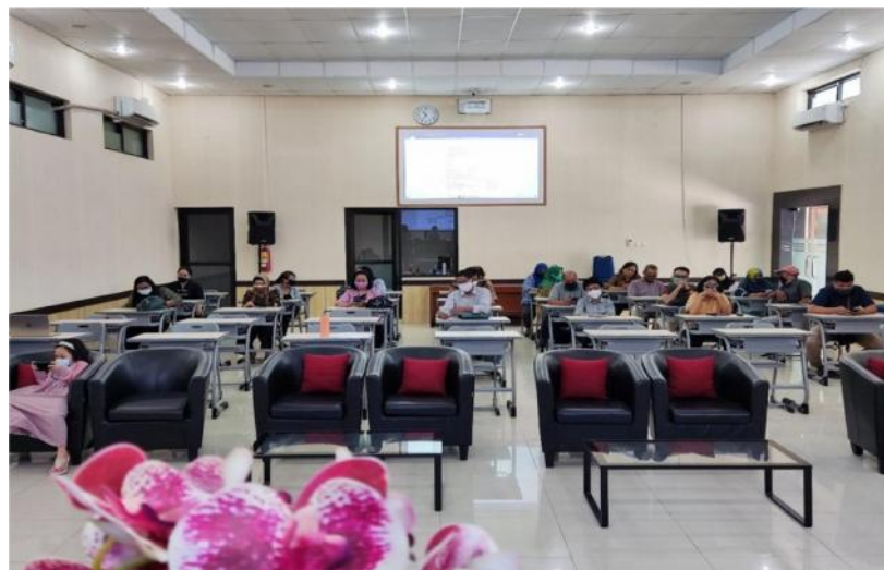
Gambar 3. Pendampingan owner peternak telur di kantor desa

Setelah dilakukan pendampingan terdapat peningkatan pengetahuan terhadap peternak ayam petelur desa Blimbing Gurah dalam pembuatan laporan keuangan dan pengetahuan mengenai perpajakan terutama mengenai lapor pajak UMKM melalui Coretax. Pada pre-test, dari 15 peserta, hanya 5 yang memiliki pengalaman, sementara 10 tidak mengerti konsepnya. Setelah penyuluhan dan praktik, post-test menunjukkan hasil positif, dengan 14 peserta memahami cara