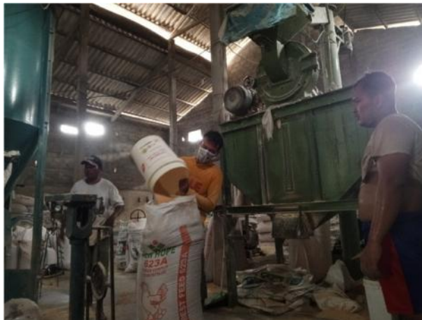
Gambar 4: Kunjungan langsung ke peternak Desa Blimbing Budi Farm