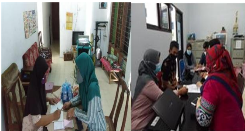
Gambar 4. Kegiatan Pendampingan kepada Mitra

menyelesaikan proses pendaftaran secara benar dan efisien. Selain itu, kepemilikan NIB menjadi langkah awal bagi Krupuk Pasir Arrofhah untuk memperoleh legalitas lanjutan seperti Sertifikat Produksi Pangan Industri Rumah Tangga (SPP-IRT), sertifikasi halal, dan pendaftaran merek dagang. Dengan adanya legalitas yang lengkap, usaha memiliki peluang yang lebih besar untuk memperluas pasar dan meningkatkan daya saing produk.