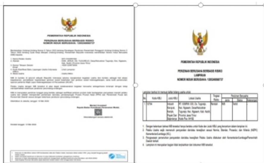
Gambar 5. Sertifikat Nomor Induk Berusaha (NIB) mitra pengabdian

Indikator pada tabel 1 menjelaskan bahwa pelaksanaan pengabdian ada peningkatan positif untuk mitra pengabdian. Pelatihan dan pendampingan yang telah dilaksanakan dalam program ini terbukti bahwa pemahaman mitra tentang legalitas NIB meningkat sebesar 70% yang sebelumnya mitra belum memahami tentang legalitas tersebut. Pengetahuan dalam penggunaan Sistem Online Single Submission (OSS) sebelumnya mitra masih belum memahami, tetapi setelah ada program pengabdian ada peningkatan sebesar 50% karena mitra masih memahami beberapa proses dasarnya sehingga kemampuan dalam mengurus NIB masih diperlukan pendampingan. Kelengkapan dokumen-dokumen dalam pendaftaran NIB telah lengkap 100% karena dokumen tersebut digunakan sepenuhnya untuk pendaftaran NIB. Kesadaran mitra akan pentingnya legalitas usaha meningkat 80% dengan dibuktikan adanya upaya mitra ingin melanjutkan legalitas halal setelah mendapatkan legalitas NIB. Ouput legalitas yaitu berupa sertifikat NIB telah terbit sehingga peningkatan sebesar 100%. Berikut adalah hasil output kegiatan pengabdian ini yaitu mitra telah memiliki sertifikat NIB yang berdampak positif pada kesiapan usaha mitra, akses pembiayaan, dan peningkatan daya saing