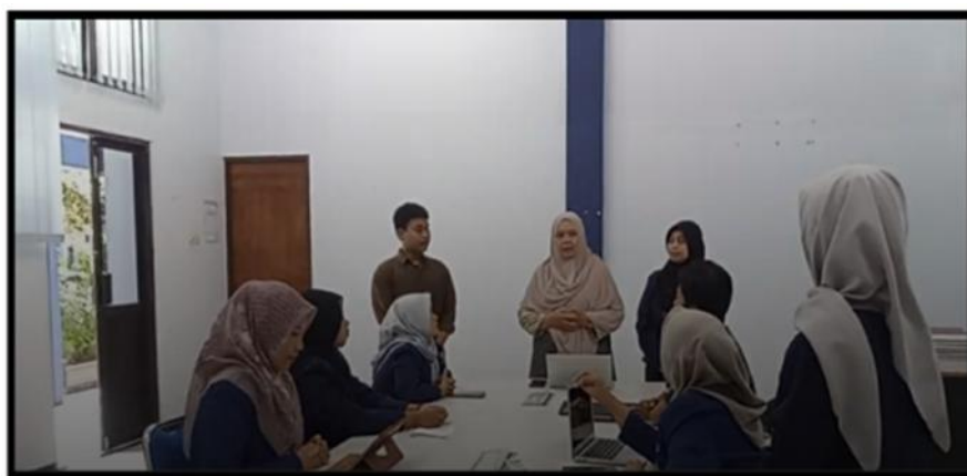
Gambar 2. Koordinasi untuk Merencanakan Kegiatan

Pada tahap pertama dalam menganalisa kondisi mitra kegiatan yang dilakukan adalah 1) Survey Lapangan . Kegiatan survey ini tim pengabdian melihat kondisi mitra seperti bagaimana kemasan produknya, bagaimana merek dagangnya apakah sudah tercantum NIB atau belum. 2) Pengumpulan Data dan Identifikasi Masalah Mitra . Pada tahap ini dilakukan untuk memperoleh gambaran nyata mengenai kondisi legalitas usaha pada mitra. Kegiatan ini dapat dilakukan melalui observasi lapangan, wawancara, diskusi, dan dokumentasi terhadap pelaku usaha. 3) Koordinasi dengan Mitra Untuk Jadwal Pelaksanaan Pengabdian . Pelaksanaan ini dihadiri oleh tim pelaksana pengabdian masyarakat yaitu Ketua dan 5 anggota tim pengabdian, serta dibantu 5 orang mahasiswa untuk membantu dalam pelaksanaan pelatihan dan pendampingan sehingga yang hadir dalam rapat koordinasi adalah 10 orang dalam rapat koordinasi internal sedangkan eksternal di hadir oleh mitra pengabdian masyarakat sebanyak 3 orang.