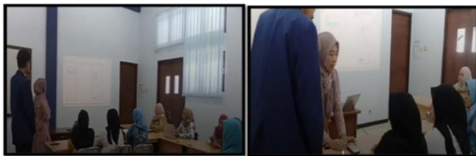
Gambar 3. Kegiatan Pelatihan dan Pendampingan Legalitas Usaha

Tahap pelatihan dan pendampingan merupakan kegiatan inti yang bertujuan untuk meningkatkan pemahaman dan kemampuan mitra dalam mengurus legalitas usaha, khususnya Nomor Induk Berusaha (NIB). Kegiatan ini dilaksanakan secara teori dan praktik agar mitra dapat memahami proses perizinan serta mampu mengurus legalitas usahanya secara mandiri. Berikut adalah kegiatan pelatihan dan pendampingan legalitas usaha yang dilaksanakan di Kampus 1 Politeknik Negeri Malang Kampus Kediri di ruang Praktek Kerja Akuntansi Satu (PKA 1)