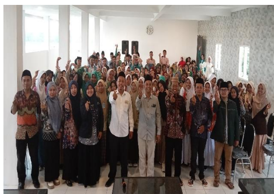
Gambar 4. Closing Ceremony

Evaluasi kegiatan dilaksanakan melalui pre-test dan post-test dengan menggunakan rubrik penilaian yang mencakup lima aspek kompetensi digital writing literacy . Pre-test diberikan sebelum pelaksanaan pelatihan untuk mengukur kondisi awal kemampuan siswa, sedangkan post-test diberikan setelah seluruh rangkaian kegiatan selesai dilaksanakan.