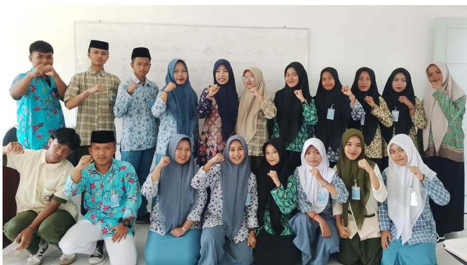
Gambar 2. Dokumentasi Pelatihan Digital Writing Literacy

Tahap pelaksanaan kegiatan dilakukan melalui dua sesi pelatihan yang berfokus pada penguatan literasi digital dan praktik menulis berbasis platform kolaboratif. Sesi pertama diarahkan pada penguatan pemahaman peserta terkait konsep digital writing literacy , penggunaan platform digital, dan etika penulisan di ruang digital. Selanjutnya, sesi kedua difokuskan pada praktik menulis menggunakan Padlet melalui tahapan brainstorming , penyusunan outline , penulisan draf, revisi, dan publikasi hasil tulisan. Selama proses pelatihan, peserta terlibat secara aktif dalam diskusi, praktik kolaboratif, serta pemberian umpan balik antarpeserta. Penggunaan Padlet memungkinkan siswa untuk menulis, berdiskusi, dan merevisi tulisan secara lebih fleksibel dalam satu ruang digital bersama. Hal ini sesuai dengan karakteristik menulis berbasis digital yang dikemukakan oleh Satria (2025), yaitu fleksibilitas, interaktivitas, dan kolaborasi sebagai keunggulan utama dibandingkan penulisan tradisional. Pendekatan ini juga sejalan dengan Maulidina, Imamah, & Dewi (2025) yang menegaskan bahwa pembelajaran partisipatif dapat meningkatkan keterlibatan dan pengalaman belajar peserta secara lebih bermakna.