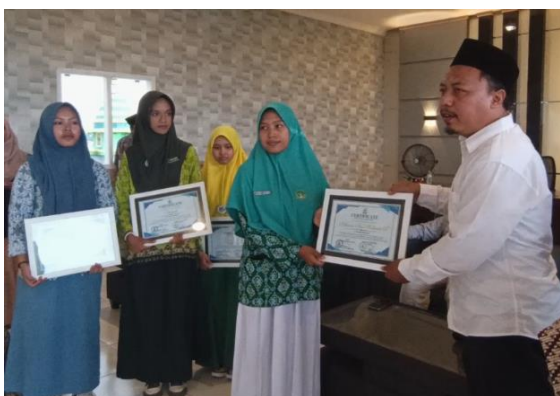
Gambar 3. Pembagian Sertifikat Penghargaan Peserta Terbaik

Setelah pelaksanaan pelatihan, kegiatan dilanjutkan dengan pendampingan intensif melalui pemberian umpan balik dan revisi tulisan peserta. Tahap ini tidak hanya bertujuan memperbaiki hasil tulisan, tetapi juga membangun proses refleksi dan pembelajaran kolaboratif secara berkelanjutan. Pendekatan tersebut sejalan dengan prinsip Participatory Action Research (PAR) yang menekankan refleksi dan perbaikan berkelanjutan melalui keterlibatan aktif peserta (Nafi, 2025). Selanjutnya, sebagai bentuk apresiasi terhadap partisipasi dan capaian peserta selama kegiatan berlangsung, tim pelaksana mengadakan closing ceremony yang dirangkaikan dengan pembagian sertifikat kepada seluruh peserta serta penghargaan bagi peserta terbaik.