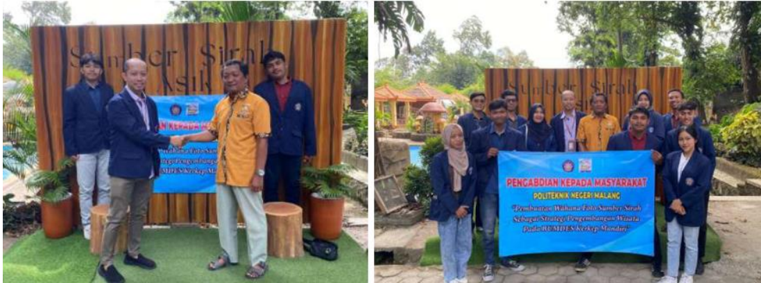
Gambar 6. Serah Terima Pembangunan Wahana Spot Foto