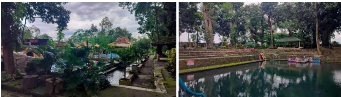
Gambar 1. Wisata Sumber Sirah Desa Kerkep

BUMDES Kerkep Mandiri selaku mitra dalam kegiatan ini adalah lembaga yang didirikan oleh pemerintah Desa Kerkep, Kecamatan Guruh. Sebagai pilar kelembagaan pariwisata di tingkat desa, BUMDES ini memegang peranan krusial sebagai lembaga ekonomi yang mengelola aset desa untuk kesejahteraan masyarakat, di mana salah satu unit usaha utamanya berupa pengelolaan wisata air Sumber Sirah yang menawarkan fasilitas kolam renang dan sepeda air bebek. Namun, berdasarkan hasil observasi mendalam, ditemukan kelemahan mendasar dalam lini strategi pengembangan produk wisata mereka.