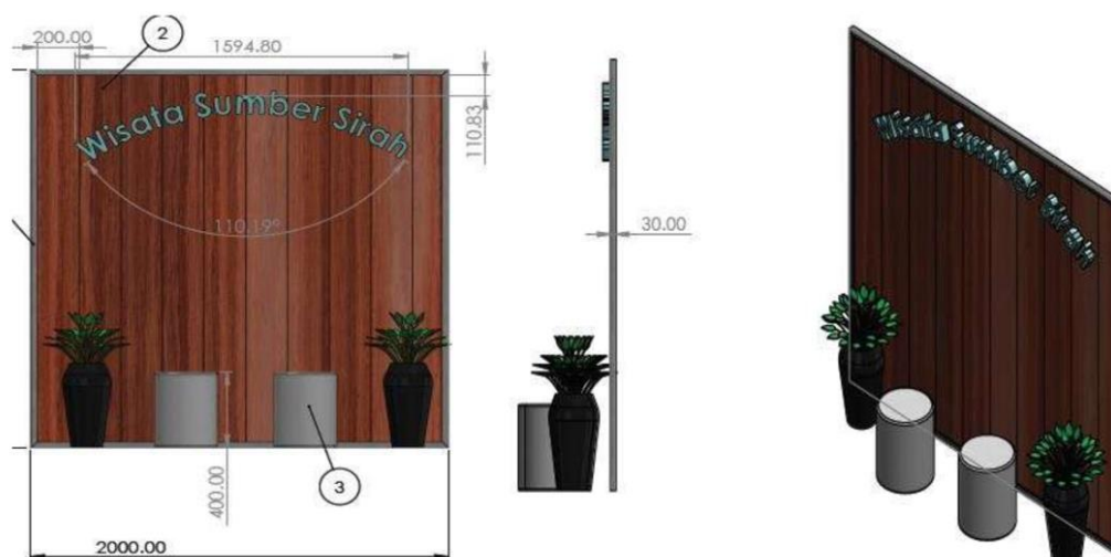
Gambar 3. Desain Wahana Foto Wisata Sumber Sirah

berukuran 3x3 sebagai rangka background , papan resplang, material cor semen untuk mencetak bangku tempat duduk, dan ornamen dekorasi berupa pot bunga.