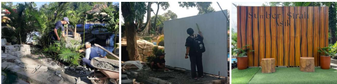
Gambar 5. Proses Pembangunan Wahana Foto