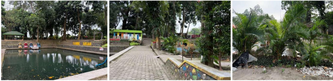
Gambar 4. Penentuan Lokasi Wahana Foto